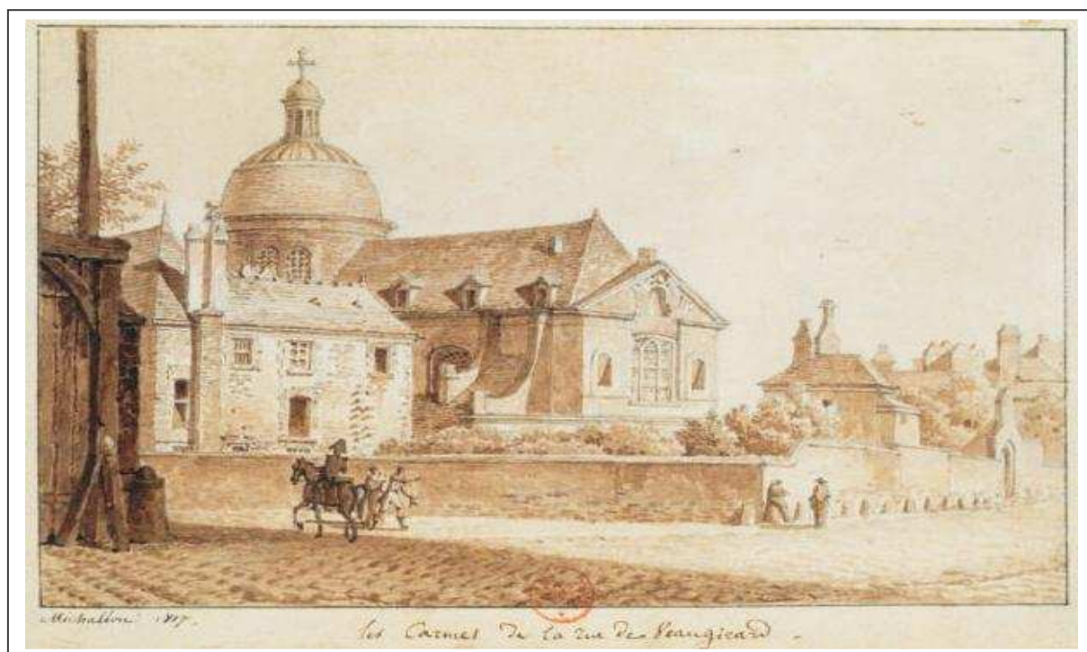
Le couvent des Carmes Déchaussés et l'église Saint-Joseph, au 70 de la rue de Vaugirard.

7ème partie : baptêmes et mariages à St André (de décembre 1793 au 25 avril 1796) ; nombreuses lacunes (entre autres de décembre 1795 à mars 1796) ; 164 actes ;